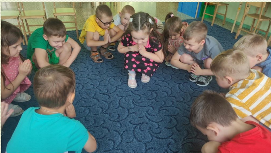
Этюд «Из семян в дерево»